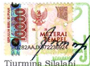
Tiurmina Silalahi Direktur